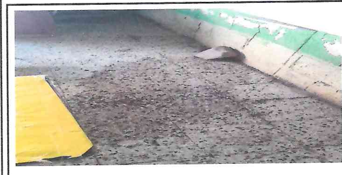
Foto 3: Reparación de piso de granito a ceramico, por encontrarse en mal estado por filtracion de agua, parte sur de la escuela, donde funciona direccion de NUFED.