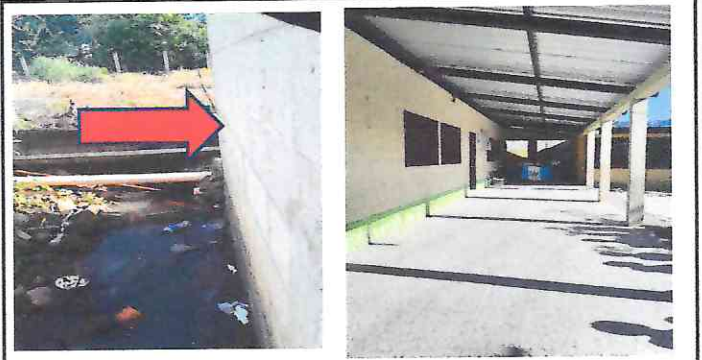
Foto 4: Reparación de puertas para parte trasera de la escuela, puerta para tienda escolar y dos de direccion de NUFED.