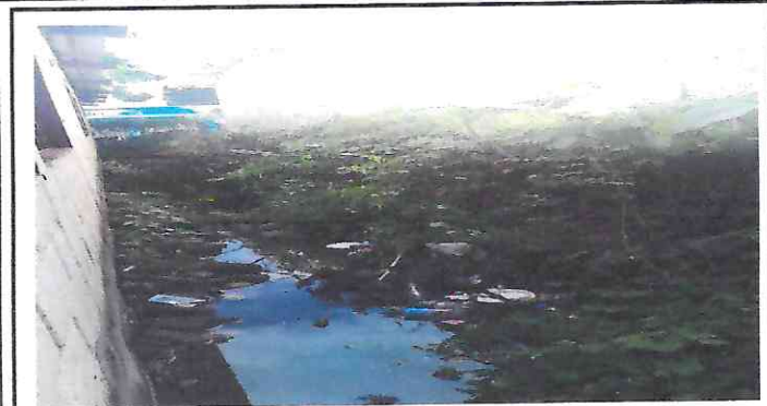
Foto 1: Reparación de Muro perimetral parte trasera de la escuela ceiba Gacha, donde se filtra agua a las aulas.