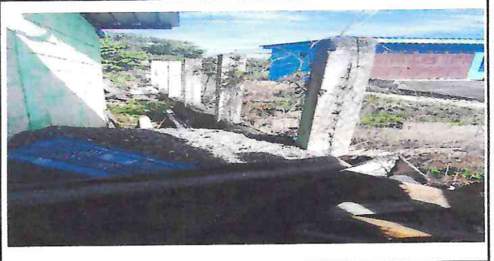
Foto 2: Reparación de muro perimetral parte norte de la escuela, qu se encuentra en mal estado la maya