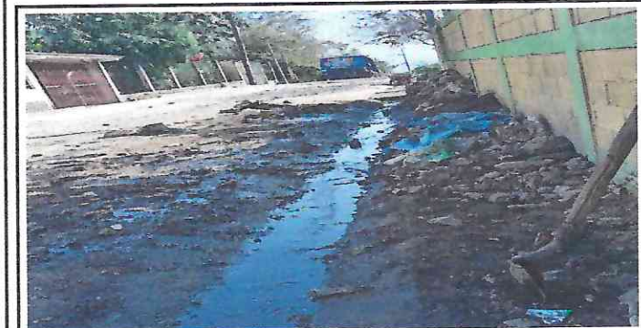
Foto 5: Reparación de cuneta en la entrada principal de la escuela Caserio Ceiba Gacha.